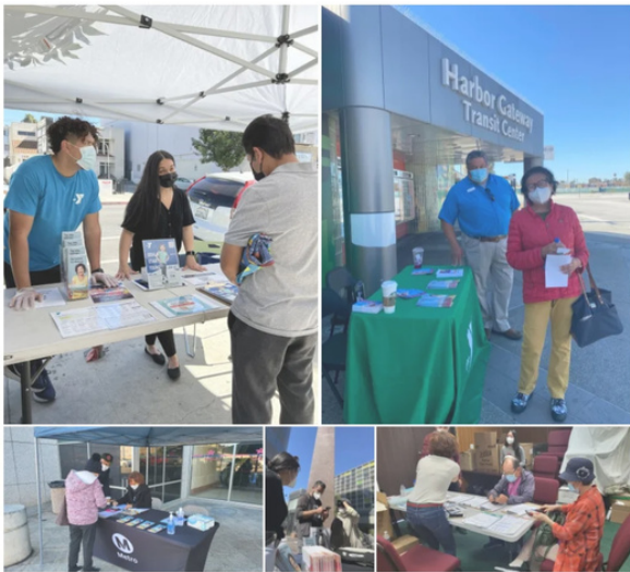
In the above gallery, CBOs work to help riders sign up for Metro's Low Income Fare is Easy program.

In November 2021, Metro released a Request for Proposals through a partnership with Civilian, a social impact and marketing company, to the Community-Based-Organization (CBO) community.