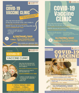
Partnering for Vaccine Equity

Last June, KAFLA received a grant from the CDC Foundation for the Partnering for Vaccine Equity program. KAFLA was the sole Korean American grant recipient in California.