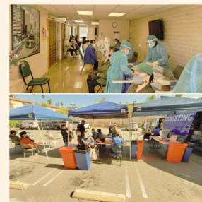
Partnering for Vaccine Equity