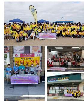
Partnering for Vaccine Equity