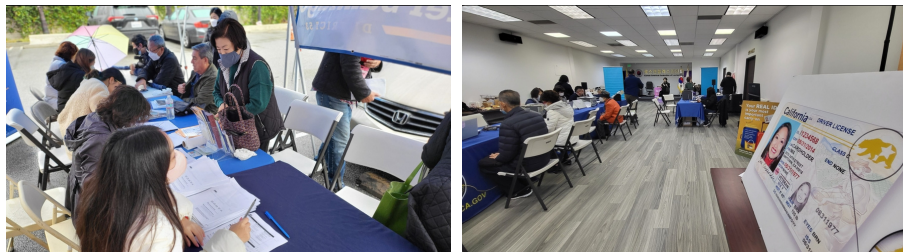
지난 2차 신청 당시 모습(12/2/2022)

There will be 15 DMV employees to accommodate a maximum of 260 appointment slots. For applicants who are unable to make an appointment for the third workshop, KAFLA plans on holding additional future workshops so please wait until the next event.