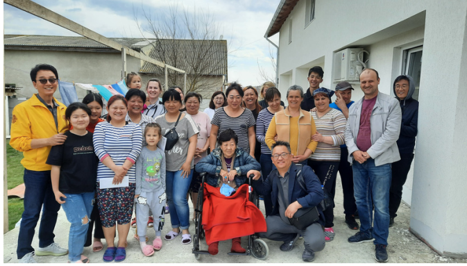
Moldova, 노을 레거먼트(새언약)교회에 피난중인 우크라이나 동포들 Korean Ukraine refugees at New Covenant Church (церква нового завіту)