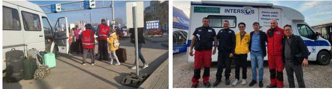
Moldova - Ukraine 국경지대, 피난민들을 UNICEF가 차량으로 이동시킨다 UNICEF helps Ukraine refugees at the border