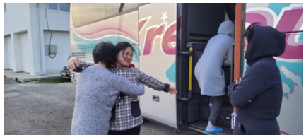
LA동포들의 성금으로 Moldova를 떠나 Romania로의 떠나는 우크라이나 동포들 With donations from Korean Americans in LA, Korean Ukrainian refugees in Moldova were safely evacuated to Romania