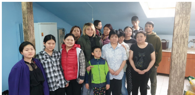
9시간의 긴 버스 이동 끝에 Romania수도 Bucharest까지 무사히 도착하신 우리 동포들 After a 9-hour bus ride, our compatriots arrived safely in Bucharest, Romania