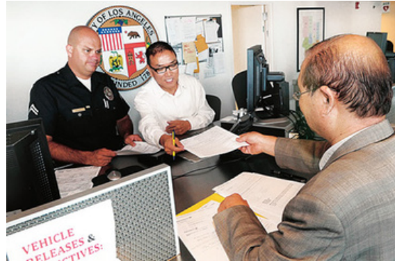
지난 2012년 8월, 올림픽경찰서 통역자원봉사자 모습

Since its establishment in 2009, the Olympic Community Police Station has been responsible for public security and crime prevention in Koreatown and nearby areas. Korean American organizations have cooperated in various ways to support the local police station in creating a safer community.