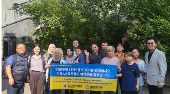
경기 안산에서 다시 만난 동포들 (9/29/2022) Reunion with Korean descendants at City of Ansan