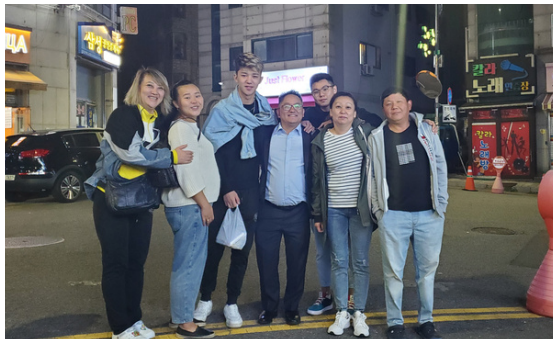
인천에서 다시 만난 동포들 (10/3/2022) Reunion with Korean descendants at City of In-Cheon

Ukrainian compatriots expressed sincere gratitude to KAFLA, Hwarang, and compatriots in Los Angeles who have provided ongoing support.