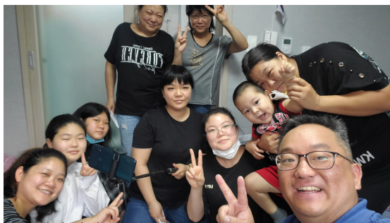
광주에서 다시 만난 동포들 (10/3/2022) Reunion with Korean descendants at City of Kwang-Ju

이에 우크라이나동포들의 한국생활을 돕기 위해, 총 $ 13,100 (경기 안산 15명 $6,300 / 광주 9명 $3,600 / 인천 8명 $3,200, 1인 평균$400지원)을 추가로 지원하였습니다.