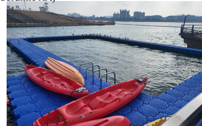
수상센터 (Yeosu Marina)