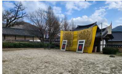
국궁 체험장 (Korean Archery)