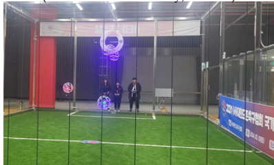
드론축구 (Drone Soccer)