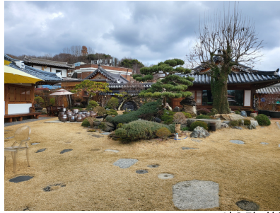
이오당, 한옥숙소(전주) 예정지 (Eodang, Korean Traditional Guest Houes, City of Jeonju)