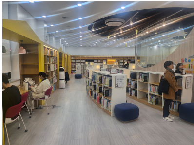
청소년 특화도서관, 꽃심 도서관 (Youth Themed Library, Kkosim)