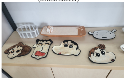
도자체험 (Pottery and Ceramic Art)