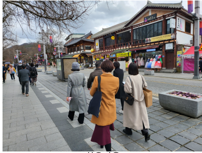
한옥마을 (Hanok Village)