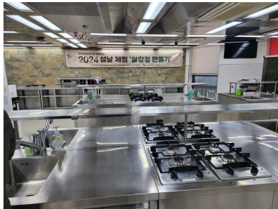
한국전통문화전당 (Korea Tradition Culture Center)