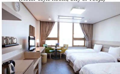
서울숙소, 유스호스텔 (Youth Hotel, Seoul)