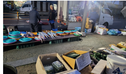
전주남부시장 (Korean Traditional Outdoor Market)