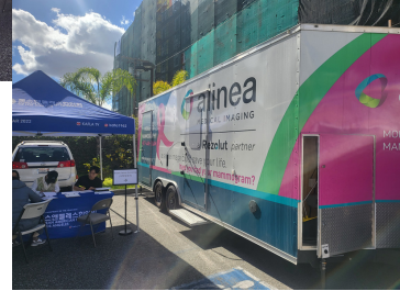
지난 2월2일 첫 여성건강검진 행사 (1st Women's Health Screening 2/2)