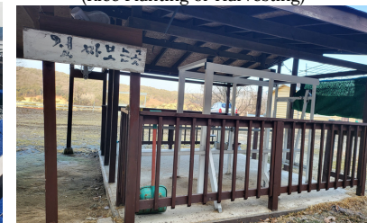
낙농체험 (Euna's Farm)