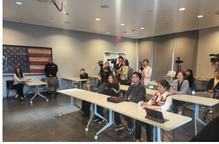
올림픽경찰서 오리엔테이션 / 봉사자들 서류 작성 Olympic Community Police Station Program Orientation / Volunteers Completing Documents